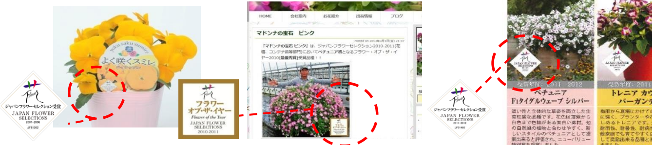
ポットに差し込むタグに受賞マークを使用。 HPなどで自社製品の紹介に。 カタログの商品紹介や店頭POPに使用。

ジャパンフラワーセレクションで「入賞」に選定された品種は、「認定登録」をおこなうことにより、花の業界が推奨する品種として「ジャパンフラワーセレクション受賞マーク」をPRに活用することができます。ロゴマークを使用することで「花業界が推奨する品種」として他との差別化を図ることができます。