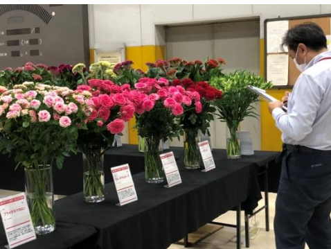
大田市場花き部中央通路での審査会の様子

なお、これら入賞した品種の中から、総合的に優秀な品種に与えられるベスト・フラワー（優秀賞）並びに新しい可能性を感じさせ、特別なインパクトを持つ品種に与えられる特別賞の受賞品種も決定いたしました。ベスト・フラワー（優秀賞）は、この年の最優秀賞である「フラワー・オブ・ザ・イヤー」の候補となります。